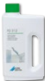
FD 312 Pintojen desinfiointi