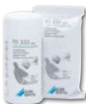
FD 333 wipes Desinfiointipyyhkeet