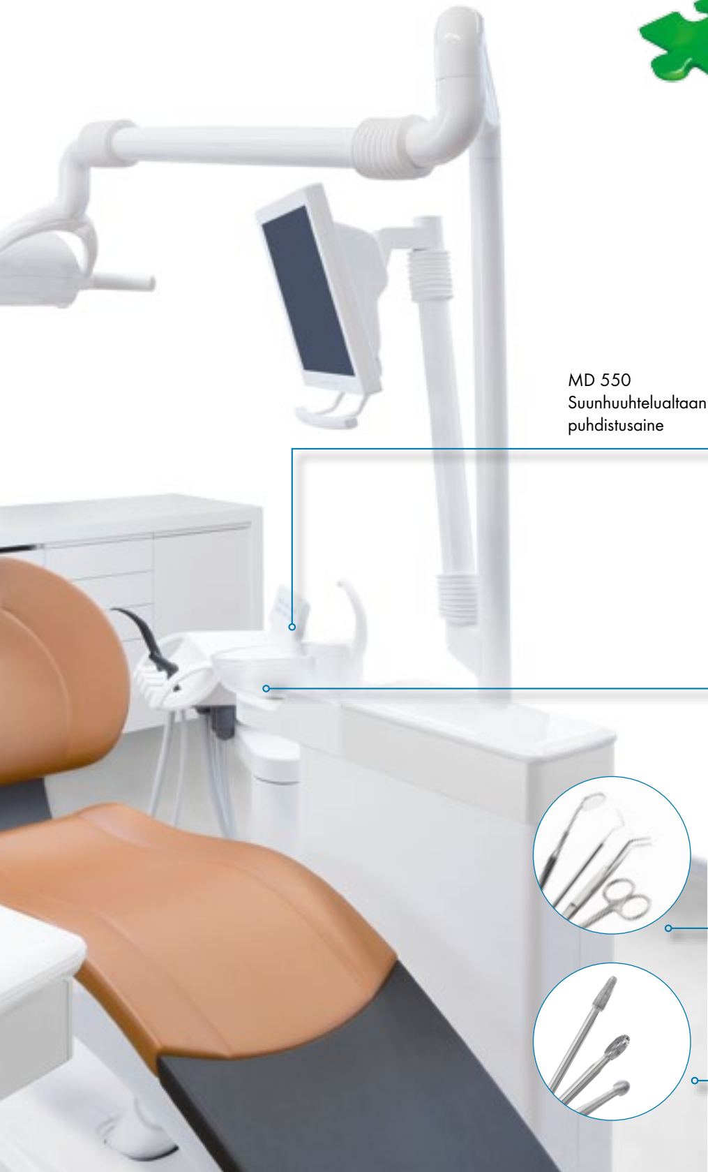
MD 550 Suunhuuhtelualtaan puhdistusaine