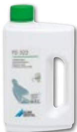
FD 322 Pikadesinfiointi