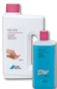
HD 410 Käsien desinfiointiaine