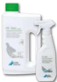
FD 366 sensitive Arkojen pintojen desinfiointiaine