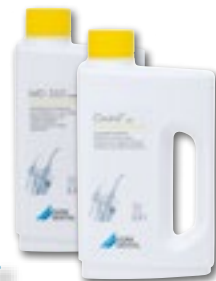
MD 555 cleaner Imulaitteiden erikoispuhdistusaine