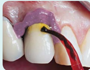
1. Porcelain Etch annostellaan Inspiral-harjakärjellä preparoidulle posliinille EtchArrest-suojan asettamisen jälkeen.