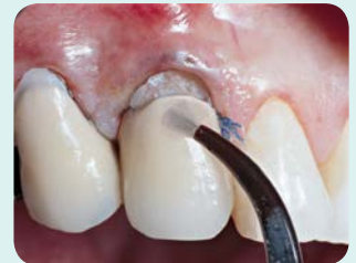
2. Silane annostellaan Ultra-Etchin ja Peak Universal Bondin jälkeen.