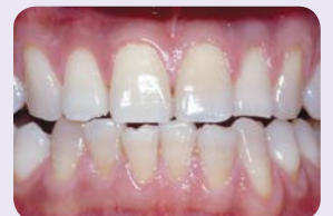
Parantumista 2 viikossa. Tetrasykliinivärjäymien hoito voi vaatia 2–6 kk.