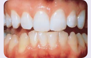
Ylähampaat 5 yön hoidon, noin 40 tunnin jälkeen.