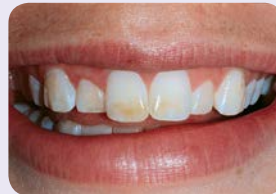
12-vuotiaan hampaat ennen valkaisua.