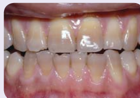
Kohtalaisia ja voimakkaita tetrasykliinivärjäymiä.