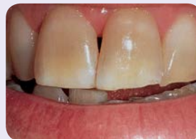
Voimakkaita tetrasykliinivärjäymiä. Näiden valkaisu voi vaatia hoidon, joka kestää useasta viikosta kuukausiin.