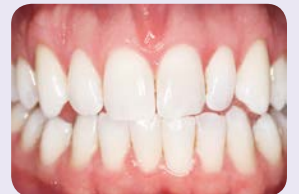
16 päivän 16 % Opalescence PF:llä hoidon jälkeen.