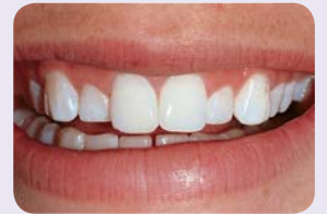
Viiden yön valkaisuun jälkeen.