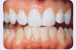
Ylihampaat 5 yön hoidon, noin 40 tunnin jälkeen.