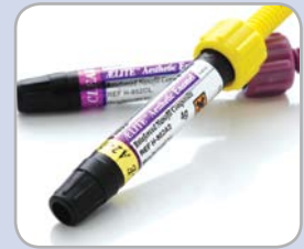
AELITE AESTHETIC ENAMEL