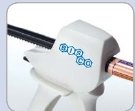
UNIT-DOSE SYRINGE, kaksoisruiskun annostelija