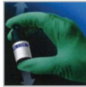
4. Ravista pulloa