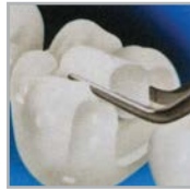
3. Kuivaus, jätä kosteaksi.