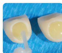
3. Annosteile Duo-Link Universal™