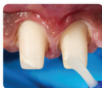
2. Annosteile All-Bond Universal