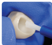
1. Annosteile Z-Prime™ Plus