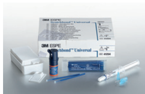
Scotchbond™ Universal peruspakkaus