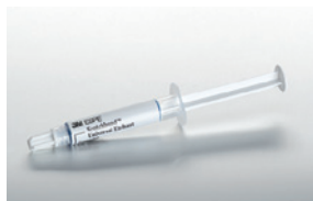
Scotchbond™ Universal etsaushappogeeli