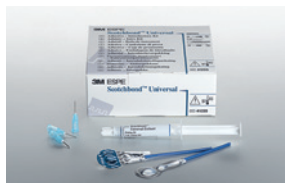
Scotchbond™ Universal peruspakkaus L-Pop™