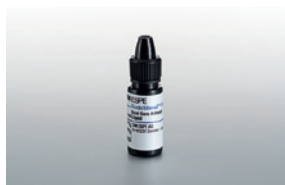
Scotchbond™ Universal DCA (pimeäkovetus) aktivaattori