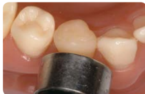
Vaihe 6: Valokoveta 20–30 sekuntia.