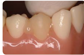
Vaihe 3: Istuta restauraatio.