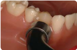
Vaihe 4: Valokoveta 2–3 sekuntia helpottaaksesi sementin poistoa.