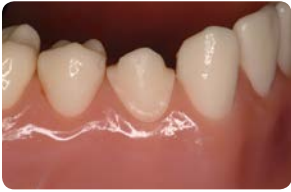
Vaihe 1: Poista väliaikaisrestauraatio ja jäännössementti.