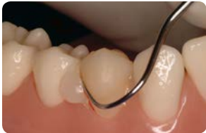
Vaihe 5: Ylimääräsementti on helppo poistaa.